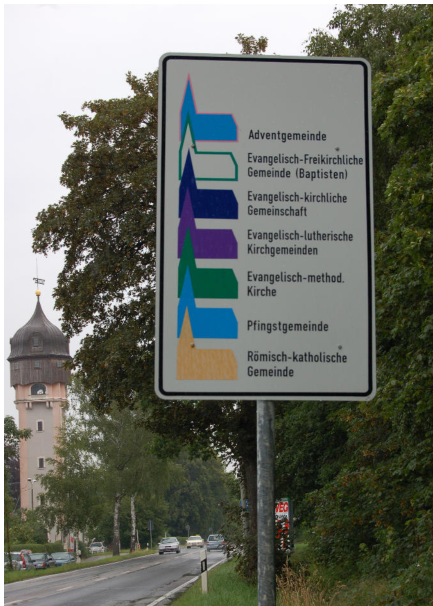
Am Ortseingang Freiberg

🎵 Schlusslied „Bewahre uns Gott“ GL 938(Eigentel) / EG 171