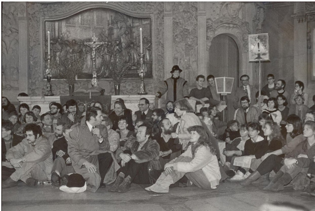
Eröffnungsgottesdienst Kreuzkirche 1988, die Delegierten finden nur auf dem Altarplatz Raum

... Das Evangelium zeigt uns den Weg Jesu als Weg der Liebe, für den die Gewaltfreiheit ein entscheidendes Kennzeichen ist. Sein Weg führt ihn gerade auch deshalb ans Kreuz, weil er gegenüber seinen Gegnern darauf verzichtet, seine Botschaft mit einem göttlichen Machterweis durchzusetzen.