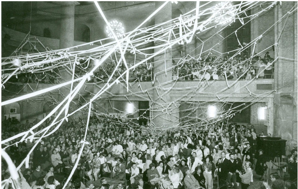
April 1989; Abschlussgottesdienst in der Kreuzkirche, Dresden

Sie sind hier nicht mit abgedruckt, die Röm.-Kath. Kirchengemeinde in Ihrer Nachbarschaft hat aber sicher ein Exemplar zur Ansicht.