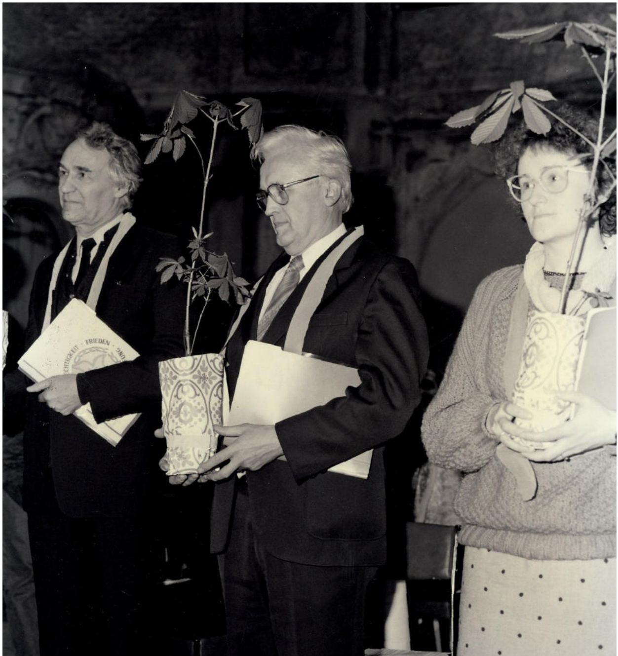
April 1989, Übergabe der Abschlusspapiere und einer Kastanie an die Kirchenvertreter