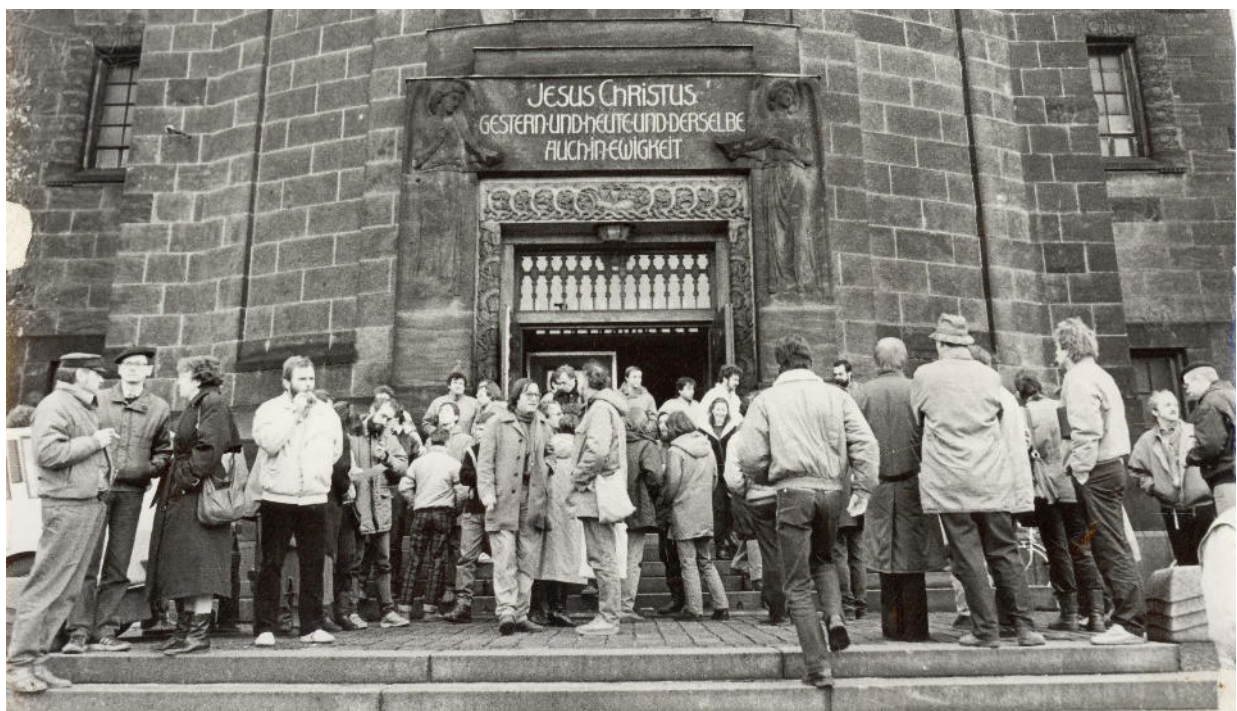
Während der Ökumenischen Versammlung vor der Christuskirche, Dresden