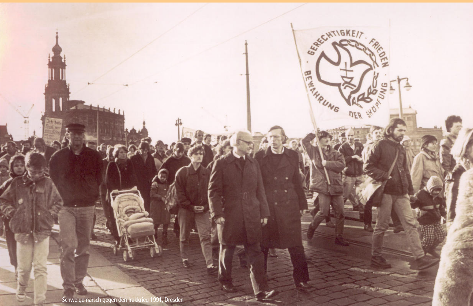
Schweigemarsch gegen den Irakkrieg 1991, Dresden