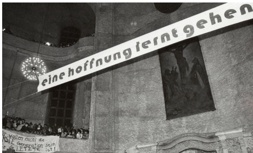
Februar 1988, Eröffnungsgottesdienst der Ökumenische Versammlung, Kreuzkirche Dresden

Muss das wirklich sein? Und können Texte, die in einen bestimmten historischen Kontext gehören, für Heutige noch relevant sein?